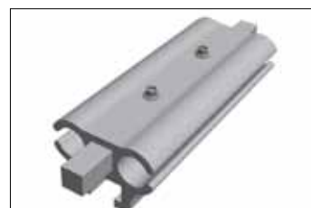
7541013 Skena 130 AL