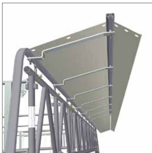
Monterad HAKITEC Släpduk