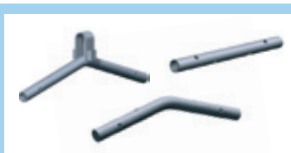
Skarvrör 450 Skarvrören skall monteras med 4 st låssprint 12 mm per skarvrör