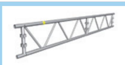
Fackverksbalk 450 AL m. byglar L=2220, 4100, 6100 resp. 8100 mm. Med byglar på vertikaler och hål i övre röret för skenfästen

Med fackverksbalk även i väggen och HAKI Trak duk hela vägen, får man en smidig och snabb lösning för den enkla hallen. Använd med fördel den prisvärda HAKITEC duken med kederlist. Levereras på rulle och kapas i samband med monteraget till rätt längd.