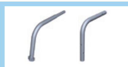
Skarvrör 37,5° yttre/inre Skarvrören skall monteras med låssprint 12 mm