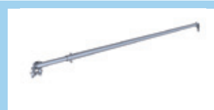
Diagonalstag 450 Teleskopiskt för fackbredd 3050/2500 Med bygelfästen