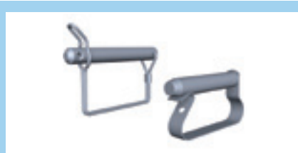
Låssprint Diameter 12 mm resp. 16 mm