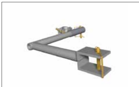
7541009 Bracket sheet mounting 3,3 kg