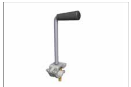
7164002 Crank with coupler 1,6 kg