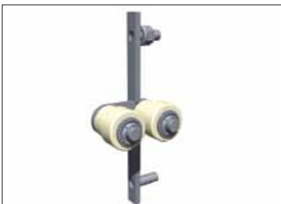
7541005 Guide Trak sheet 1,1 kg